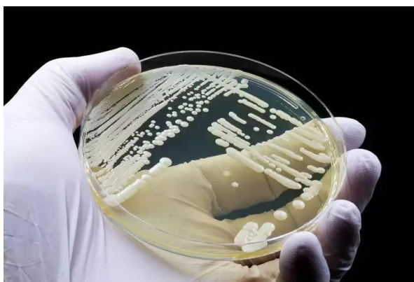
Figura 8.1 Placa de cultivo C. auris

Candida auris (Figura 8.1) é uma levedura que se reproduz por brotamento, apresentando blastoconídeos isolados, em pares ou agrupados. Em condições de cultivo variadas, exibe fenótipos morfológicos ovóides, elipsoidais ou alongados, com dimensões entre 2,5 e 5,0 µm (Figura 8.2). Embora a coloração e morfologia das colônias possam sugerir sua presença, esses parâmetros não são suficientes para uma identificação definitiva, sendo necessários métodos moleculares e espectrométricos para confirmação (CDC, 2024).