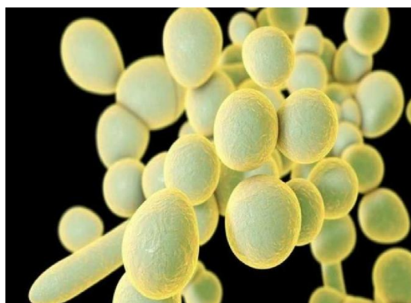
Figura 8.2 Aspecto morfológico C. auris

gienização das mãos e no manejo de dispositivos contaminados. O fungo tem sido isolado de múltiplas superfícies, desde áreas de alto contato, como grades de cama, mesas e equipamentos médicos, até superfícies mais distantes, como pisos e janelas, demonstrando sua capacidade de persistir por longos períodos em materiais inertes. Essa resistência ambiental, somada à tolerância a desinfetantes de uso rotineiro, dificulta o controle da disseminação hospitalar (CDC, 2024).